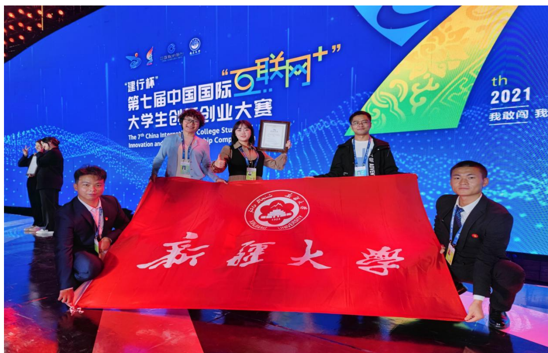
（新疆大学代表队在颁奖典礼合影）

“互联网+”大赛启动后，我院党委高度重视、积极组织、大力宣传，广大师生踊跃参与、认真准备，共有 52 个项目、参与人数达 500 余人次，今年 7 月，我院在“互联网+”大学生创新创业大赛”新疆赛区选拔赛中，取得 1 金 3 铜的好成绩，通过大赛组委会层层选拔，我院《智慧猪业—基于声纹识别的生猪疾病预警解决方案》项目在全球 228 万支项目团队中脱颖而出，获得总决赛现场赛资格并荣获大赛最高荣誉。