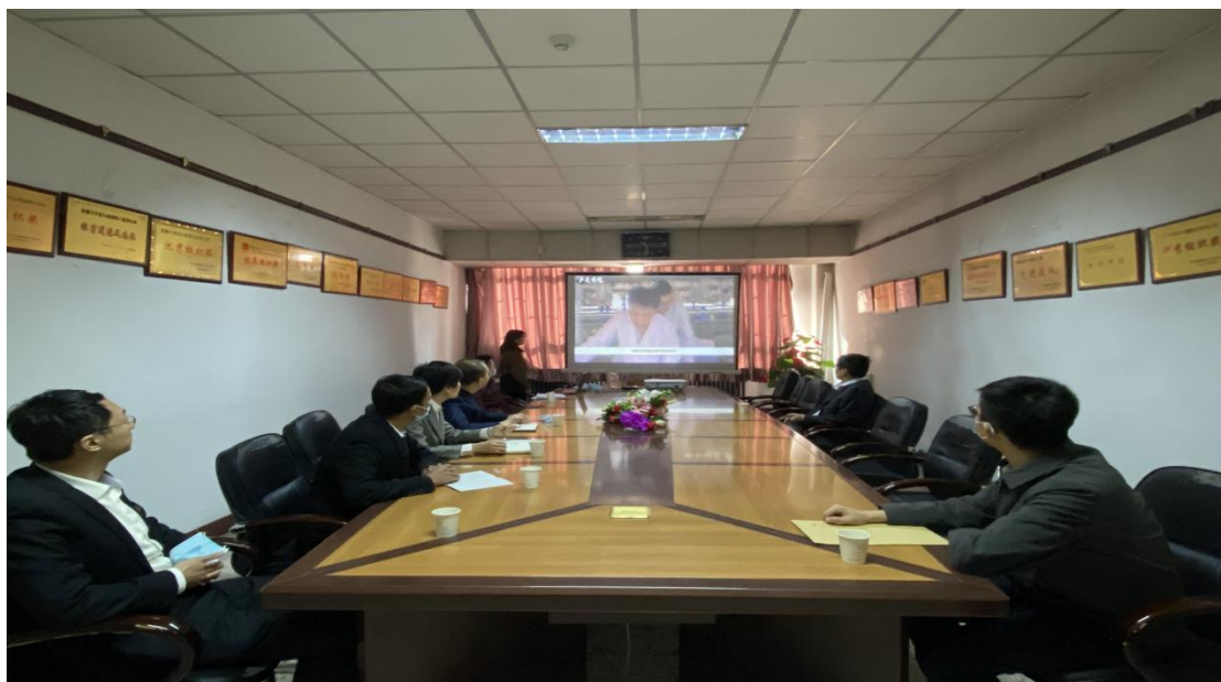
(新疆大学姚强校长来到软件学院给予参赛团队专业指导)